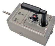
Prøveapparat til test af skarpe kanter