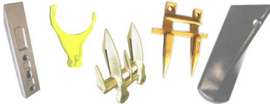
Dele til landbrug