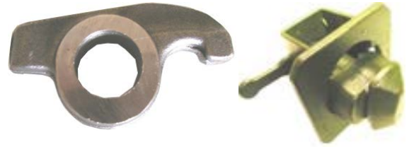
Vippemekanismer og ophæng