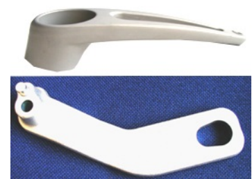
Håndtag og greb

Med forbehold af fejl og tekniske ændringer.