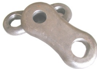
Kæder og clips