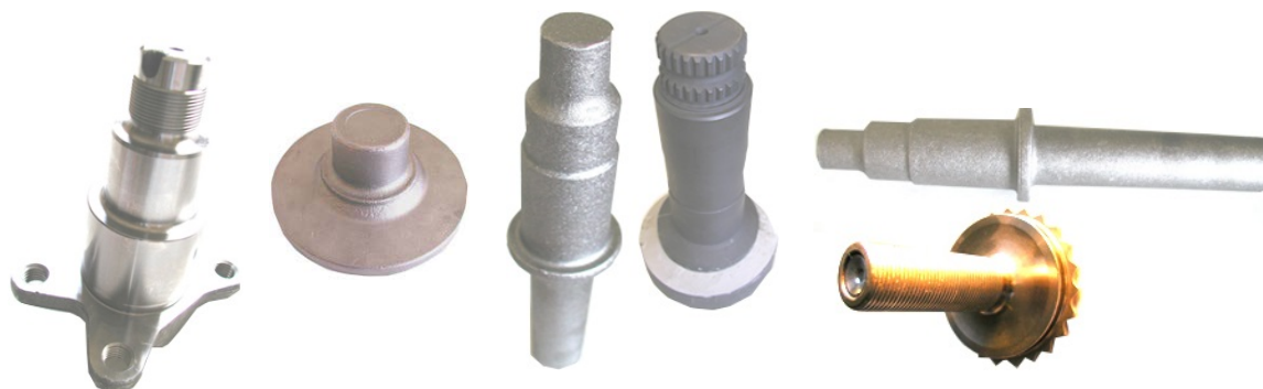
Nav, aksler og tandhjul