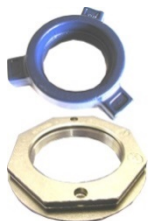
Møtrikker og bolte