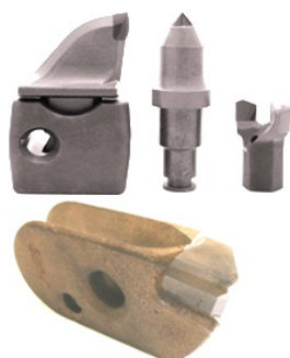
Skære- og boreværktøj

Nedenfor ses eksempler på dele fra KimberMills.