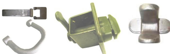
Beslag og hængsler til ophængning